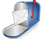
imagen de una casilla de correo con una carta dentro.